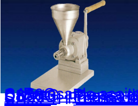
Prensa de aceite