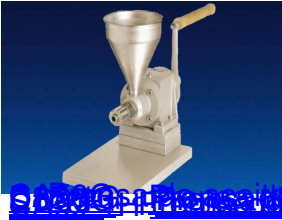
Prensa de aceite